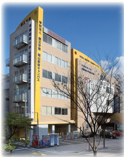
吉備国際大学 岡山駅前キャンパス

当日は、同会場にて13時から14時30分まで「附属研究所（保健福祉研究所、心理・発達総合研究センター、文化財総合研究センター）合同シンポジウム」を開催いたします。こちらもぜひご参加ください。