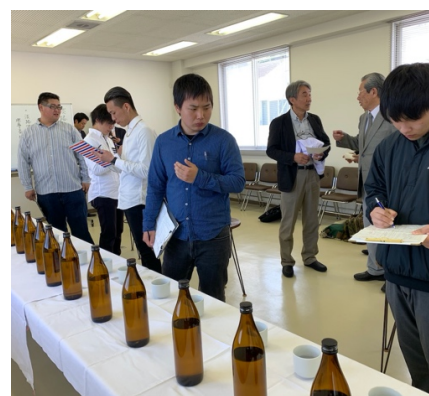
◇ 淡路酒造組合新酒鑑評会