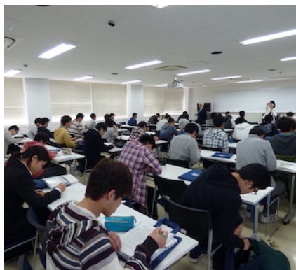
◇ 春のオリエンテーション