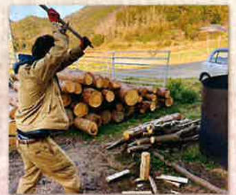
獣害対策の柵作りのための薪割り