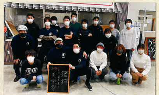
伊加利地区と合同フェア

南あわじ市伊加利地区では、田畑を荒らすイノシシやシカの害獣問題が深刻化しています。しかし地区では、それを逆にとり、ジビエを地域の特産品にするまちおこしが行われています。