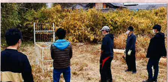
地元の方の依頼で箱わなを設置