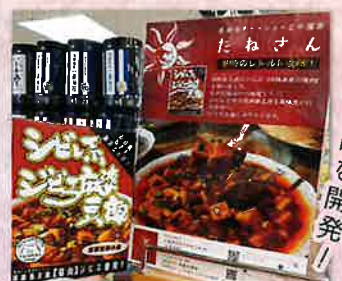
兵庫ふるさと館に置いていただきました