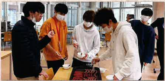
鹿肉のソーセージの試食会

令和3年11月27日、伊加利地区の住民らによる「伊加利源泉マルシェ実行委員会」と農学部の狩猟部が、共同で淡路島産ジビエのおいしさを発信するイベントを開催しました。当日用意した定食やラーメンなどすべて完売し、大盛況のイベントとなりました。今後も、淡路島産ジビエを伊加利地区の地域産品とする大学と連携した取り組みが期待されます。