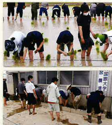
「きぬむすめ」の苗を植える学生達

パッケージデザインは、吉備国際大学アニメーション文化学部が作成。南あわじ市の花である「日本水仙」をデザインしています。日本酒名は、農学部のキャンパスがある地名「志知」に由来しています。