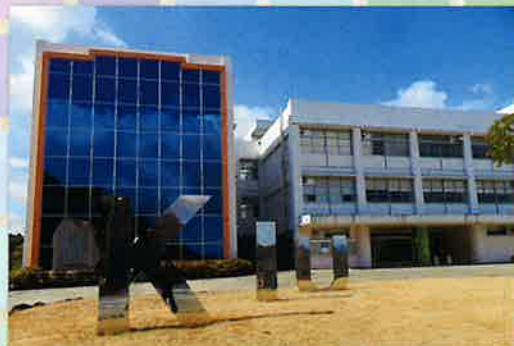
吉備国際大学キャンパス外観