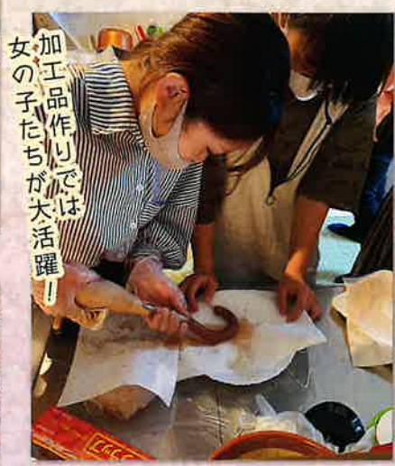
捕獲したイノシシ肉を使用してソーセージを自作