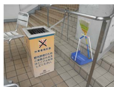
喫煙場所に設置された清掃用具