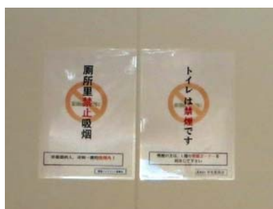
トイレの喫煙禁止ポスター