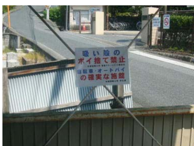
駐輪場の「ポイ捨て」禁止ポスター