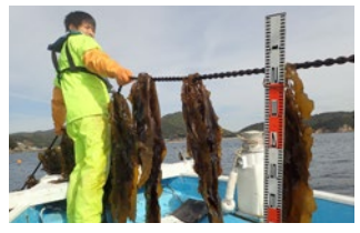
釣りや漁業の魅力を分析し ライフプランへの組合せを考えます。

大自然を満喫出来る4年間、 五感を刺激する学びや遊びで身につく 自然力・発想力・対応力は将来の職場や生きていく上で 必ず役に立ちます!!