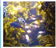
水産系のビジネスや 地域活性化が 出来る人材を育てます。